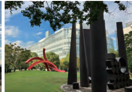
ウエストプロムナード公園