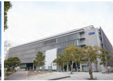
東京都立産業技術研究センター