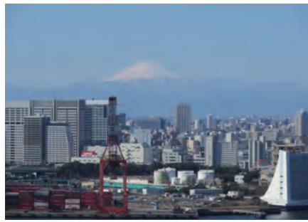
当ビルからの眺望(富士山)