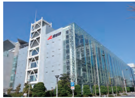
産業技術総合研究所 臨海副都心センター