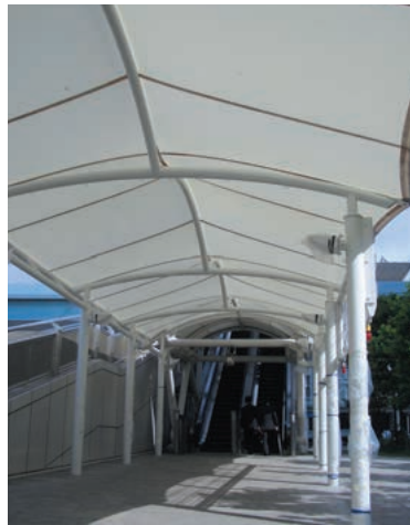
屋根付き回廊 完成予定7月

これに対応すべく、お客様に満足していただける環境づくりやサービス改善のための事業経費を重点的に計上しております。まず、誰もが安心できるわかりやすい施設案内を目指して展示ホールや駐車場などへの案内サインの大幅改修(2億9千万円)、インフォメーションカウンターも新設(8百万円)します。また、直射日光を和らげるための遮光フィルム貼付(6千万円)や喫煙室の設置(5千万円)によって、快適環境づくりを推進します。さらに来場者の利便性を高めるため、現在イーストプロムナードに建設中の屋根付回廊を施設内にも延長して設置(今年度分7千8百万円 総額約5億円)します。