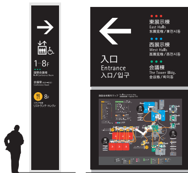
案内サイン改修 完成予定8月