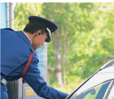
▲催物内容が違えば来場されるお客様も違う。臨機応変な対応が求められます。

これだけの施設ですから当然駐車台数も多い。催物が終わって渋滞が起きてしまったのでは展示会場としてのイメージが悪くなりますよね。スムーズな誘導で、お客様にいかに使いやすい施設だと伝えられるかが大切だと思っています。