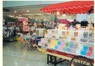
プッシュカート広場