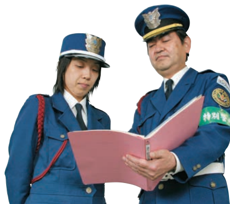
▲打ち合わせは、毎日、綿密に。

お客様の「安全」「安心」「快適」を 私たちが支えているんだ。 そう思うと1分1秒も気を抜けない。