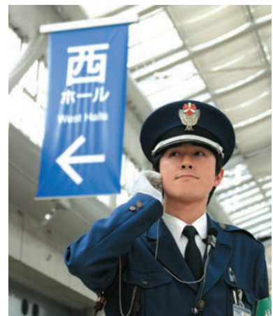
▲2年前に副隊長に。その重大さに、当初は夜眠れなかったです(笑)。休日は、お客様の視点を知らたくて催物に参加することも。

制服の左肩に「東京ビッグサイト」の文字があるでしょう。私たち一人ひとりが、ビッグサイトの看板を背負っている、対応ひとつでビッグサイトの印象が決まる、そう思うと責任を感じますね。