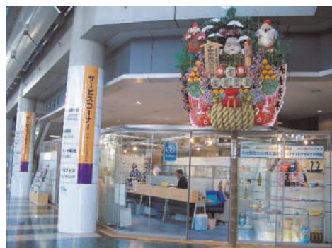
設置場所:会議棟2階エントランスホール サービスコーナー「ネイヴル」前