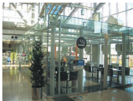
会議棟2階エントランスホールのクリスタルラウンジに設けられた喫煙室。イスとテーブルもあり、ゆっくり食事や休憩ができます。

平成17年4月1日より、喫煙は喫煙室・喫煙所のみで可能となります。皆様のご理解とご協力をよろしくお願いいたします。