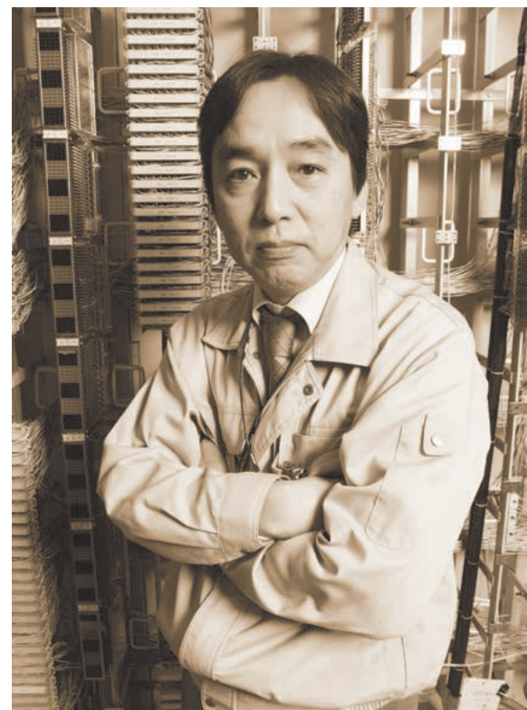
▲東京ビッグサイトの勤務になって、もうすぐ7年ですが、未だに毎日が勉強の日々です

「1回でつながればいいのですが、それが、なかなか(笑)。その点、電話回線は、単純明快です。繋がらなければ回線に問題があるわけですから。インターネット回線の場合、回線に問題があるのか、プロバイダに問題があるのか原因が分からない。一つひとつ、原因をつぶしていくしかないんですよ。線を引き直したり、プロバイダを変え