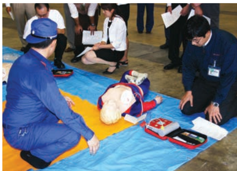
多くの関心が寄せられたAED操作訓練。参加者の表情も真剣そのもの。

中でも、多くの参加者の関心が寄せられたのがAED(自動体外式除細動器)です。消防署員の指導のもとに行われたAEDの実体験的な操作訓練では、緊急時の人命救助にかかわるものだけあって、大勢の参加者が熱心に訓練に取り組んでいました。