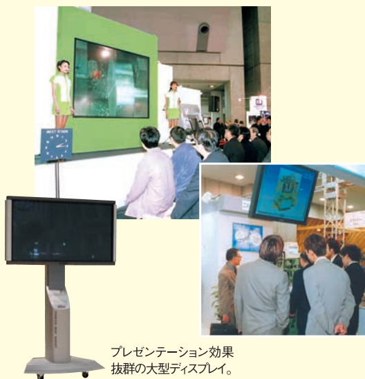
プレゼンテーション効果 抜群の大型ディスプレイ。

ビッグサイトでは、映像・音響機器のレンタル事業を拡充し、手軽で便利に各種機器をご利用いただけるようになりました。プラズマディスプレイやLEDスクリーン、スピーカーやマイクなど、最新の機器を取り揃えています。