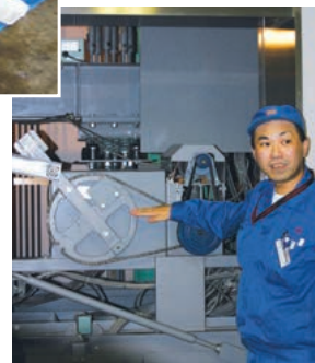
エレベーターが途中階で停止した場合の対処要領について、実際の機器を見ながら学びました。