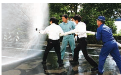
屋外消火栓を使った消火訓練。水の勢いが強いため、複数人でホースを支えて消火活動を行います。