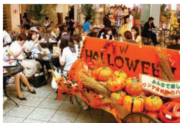
ハロウィンでおなじみのおばけカボチャがアトリウムを楽しく演出します。