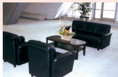
各種のイスやテーブル、応接セットからフォークリフトまで、展示会のリース用品を豊富に取り揃えている。

出品物等の集荷・搬入搬出・輸送を一括管理し、コスト削減や環境負荷の軽減に寄与する「ビッグサイト スマート物流」や、展示会運営の警備業務を受託する「ビッグサイト スマート警備」などをスタートさせ、さらなるサービスの向上に取り組んでいます。