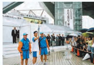
アテネオリンピック2004 聖火リレー／東京