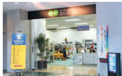
ビジネスセンター