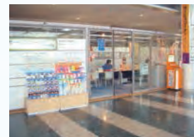
サービスコーナー