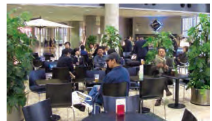
クリスタル・ラウンジ