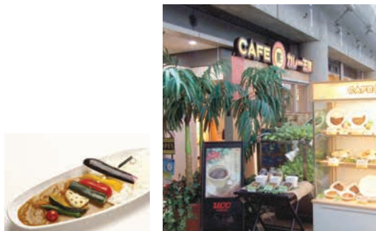
彩り野菜カレー(950円)

野菜をふんだんに使った「彩り野菜カレー(950円)」や大胆にトマトを丸ごと1個のせた「丸ごと焼きトマトカレー(950円)」など、ヘルシーな新作カレーは女性にも大人気です。テイクアウトコーナーも新設。価格もお求めやすくなりました。