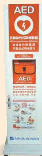
AED（自動体外式除細動器）

東京ビッグサイトでは、消防署員の指導のもと、通報・初期消火・応急救護などの自衛消防訓練を定期的に行っています。その中で、AEDの実践的な操作の習熟に努めています。