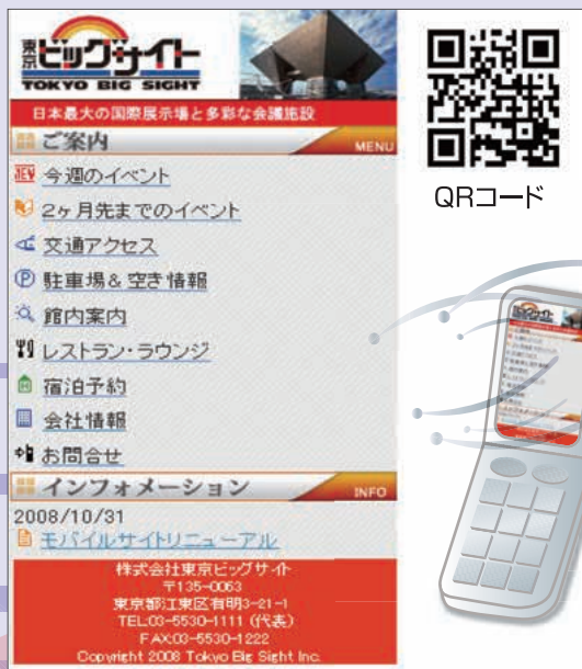
〈東京国際展示場モバイルサイト〉 http://www.bigsight.jp/m

東京ビッグサイトの携帯(モバイル)サイトは、ドコモのiモードに対応するものがありましたが、ソフトバンク、auの携帯電話を含め、3キャリア対応型モバイルサイトを昨年11月リニューアル致しました。従来は、イベントスケジュール、交通アクセス、駐車場案内のみ表示していましたが、お客様のニーズにより、館内案内、レストラン・ラウンジ、宿泊予約、会社情報の項目を追加し、充実した内容になっております。ご来場の際は、モバイルサイトも是非ご活用下さい!! ※それぞれ、QRコードからも読み取りが可能です。