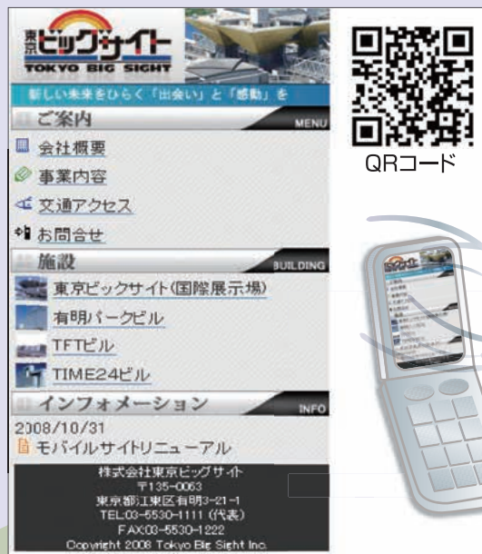
〈会社情報モバイルサイト〉 http://www.tokyo-bigsight.co.jp/m