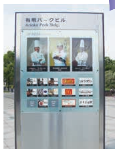
▲鉄人レストランの案内

和食の中村孝明、フランス料理の坂井宏行、イタリア料理の片岡護ら3鉄人の顔を掲載し、料理の写真を盛り込んだ案内サインタワーの他、壁面には館内マップ、2階正面の円柱はライトアップした案内サインが目立つ位置にございます。案内サインタワーは、1階屋外に3箇所設置しており、夜はライトアップするなど高品質なイメージで、レストラン街へ来られる皆様に歓迎しております。東京ビッグサイトへ来られた際、ランチにディナーにパーティに、アフターコンベンションには有明パークビルのレストラン街を是非ご利用ください!!