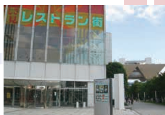
▲入口にある案内サインタワー