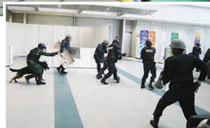
▲テロ犯人を東京湾岸警察署へ連行